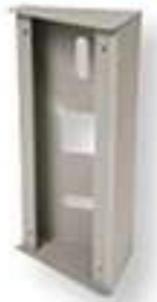
MGF30 Boîtier d'angle pour JODV