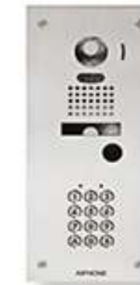
KJKF* Adaptation façade inox avec clavier rétro éclairé 100 codes