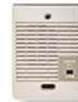
IER2 Extension d'appel