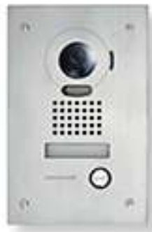
JODVF Platine de rue encastrée résistante au vandalisme