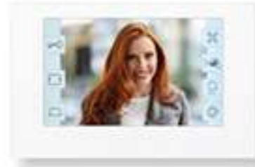
JO1MDW Poste maître Wi-Fi