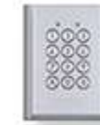
AC10S Clavier saillie résistant au vandalisme