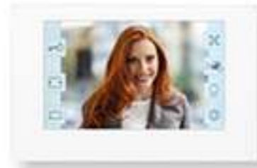
JO1MDW Poste maître Wi-Fi