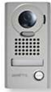
JODV Platine de rue saillie résistante au vandalisme