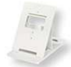
MCWSA Support bureau avec réglage en inclinaison

* Livrée sans caméra : prévoir kits JOS1FW ou platine JODVF. (1) enquête réalisée auprès de 1 122 particuliers ayant installé un interphone Aiphone. Résultats au 1 er décembre 2018.