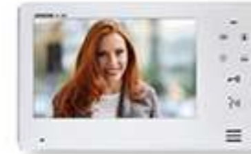
JO1FD Poste secondaire